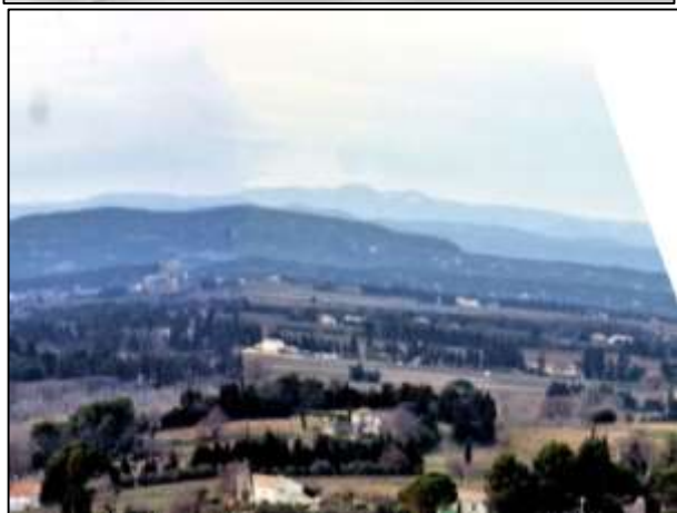
Comparaison entre le relief théorique et la réalité. En rouge, les cratères suc de Pal et suc de Beauzon