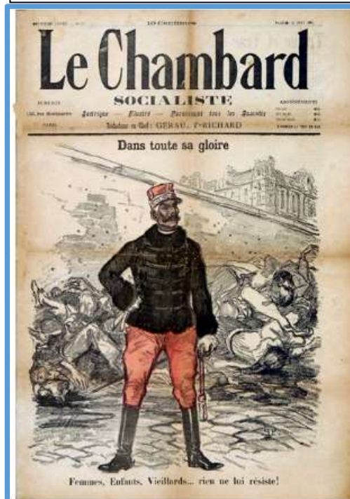
Caricature de Steinlen (1894)

Source privée Le général de Gallifet est représenté dans une pose raide entouré de cadavres. Le titre et la légende « Dans toute sa Gloire » et « Femmes, enfants, vieillards... rien ne lui résiste ! » font référence aux exécutions sommaires de la « semaine